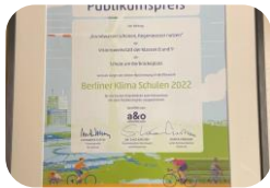
Publikumspreis der Berliner Klima Schulen 2022