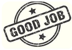
Das Schul- und Sommerfest!