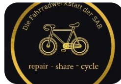
Pfefferwerk Stiftung 2022 (Fahradwerkstatt Repair und Share)