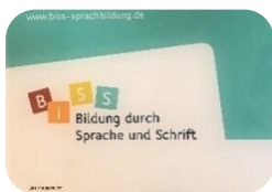
BiSS - Schule!