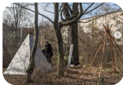
Grün-macht-Schule: Der Tipi-Wald