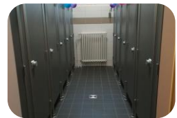
Neue Toiletten für Schüler:innen 2021 und 2022