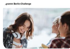
Aufnahme in die Berlin-Challenge 2023/2024