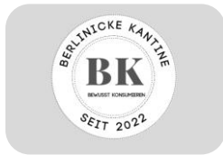
2. Platz - Internationale Nachhaltigkeitsschule/ Umweltschule in Europa 2022