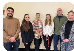
Unser Team der Schulsozialarbeit