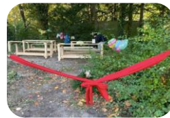
Grün-macht-Schule: Das Grüne Klassenzimmer