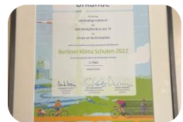
Berliner Klima Schule 2022